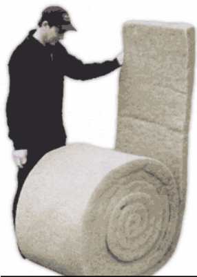
Technichanvre en rouleau